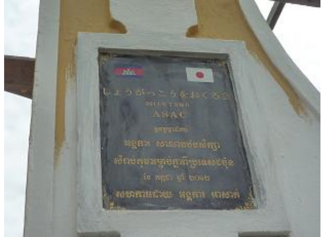
校門に取り付けられたドナープレート