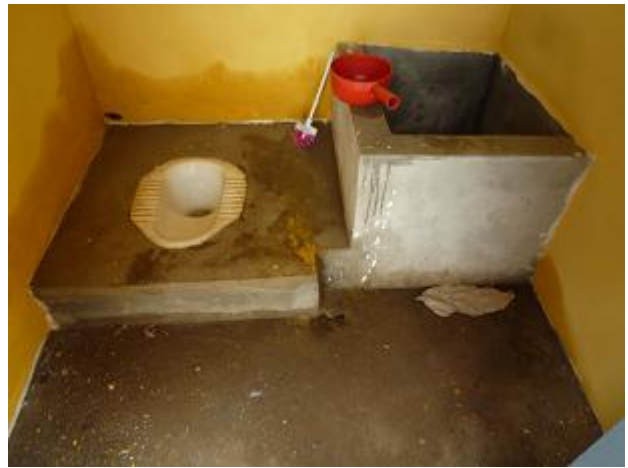
トイレの中の様子