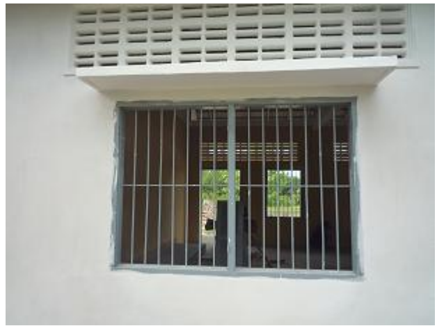
窓の枠と鉄格子の様子