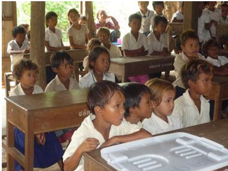
集中して絵本の読み聞かせを聞く子どもたち