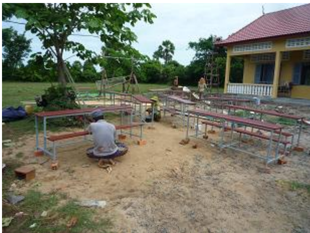
生徒用机と椅子の塗装作業