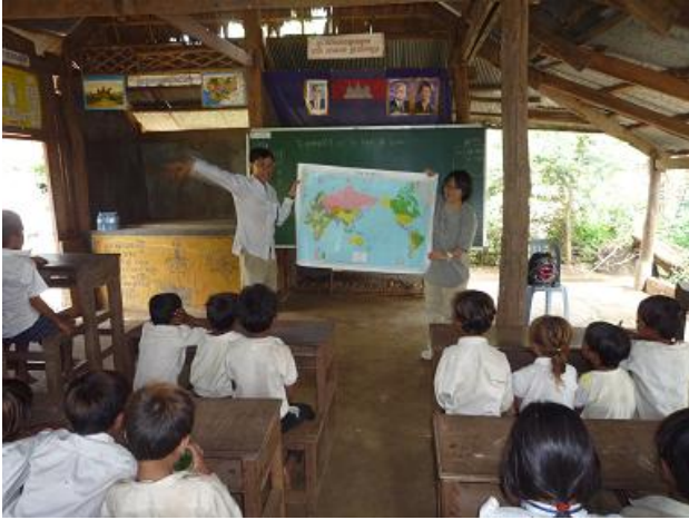
世界地図を使ってカンボジアと日本の位置の紹介