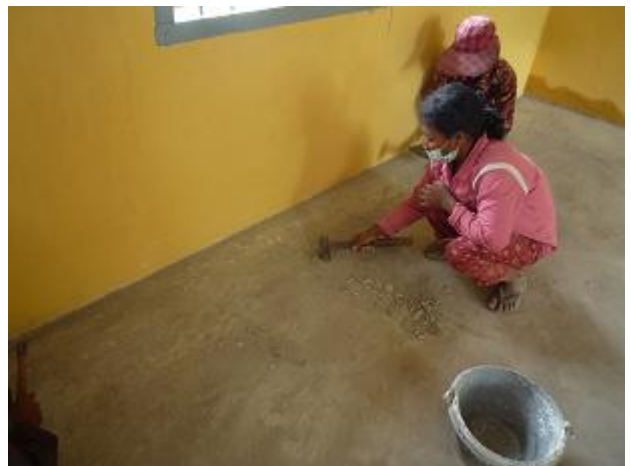
床をスムーズにするため削る作業