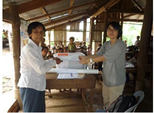
校長先生へ図書の贈呈