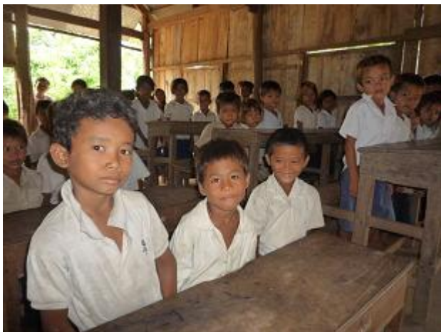
古い校舎で学ぶ子どもたち