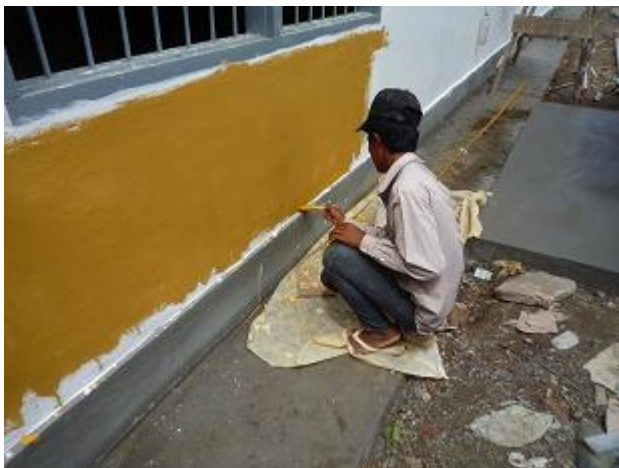
3回目仕上げ塗装作業の様子