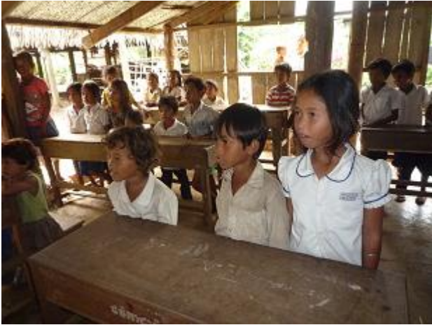
本の紹介を見ている子どもたち