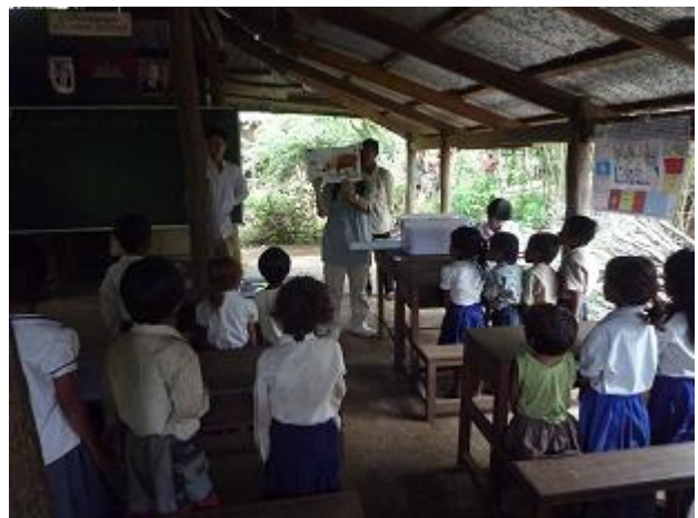
ASAC スタッフが本の紹介 みんな立ちあがって見ている