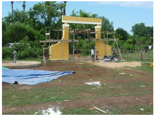
校門（裏側）と井戸の様子