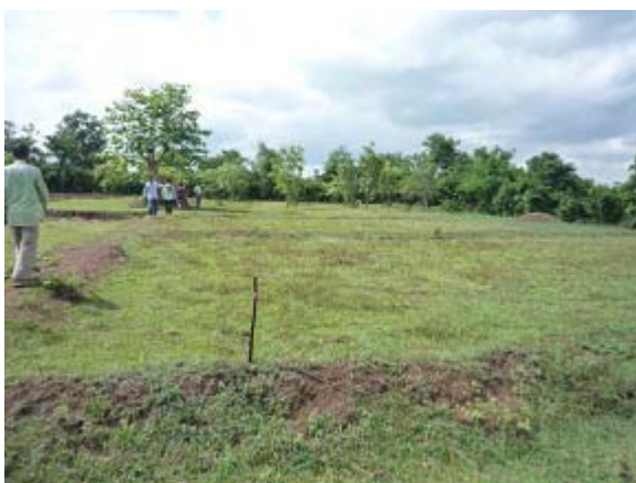
新校舎建設予定地