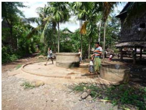
学校の敷地内にある井戸